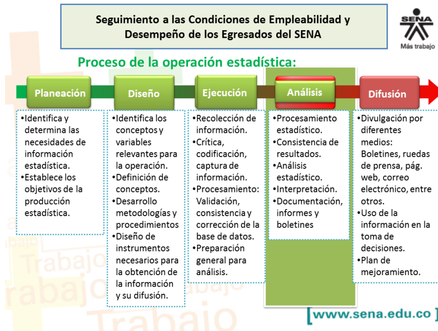
Ilustración 1 Modelo del proceso estadístico para el seguimiento a los egresados del SENA.