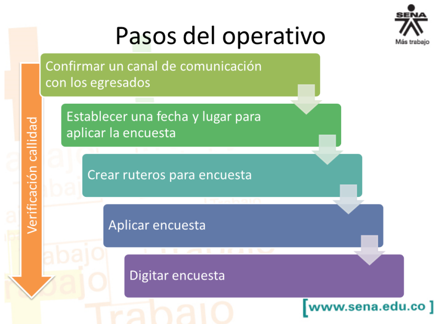
Ilustración 5 Operativo de campo para aplicación de encuesta del seguimiento a egresados del SENA