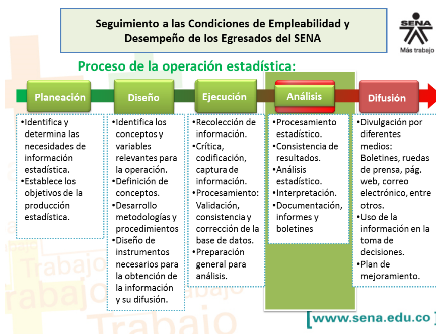
Ilustración 1 Modelo del proceso estadístico para el seguimiento a los egresados del SENA.