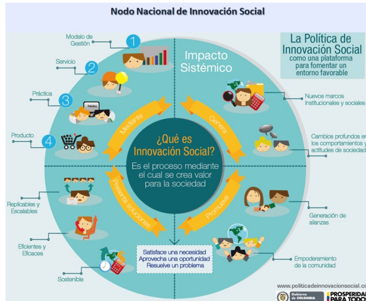
Nodo nacional de Innovación Social

su sostenibilidad económica y social, empoderando a las comunidades receptoras de la innovación como sujeto activo en el ciclo de desarrollo del emprendimiento.