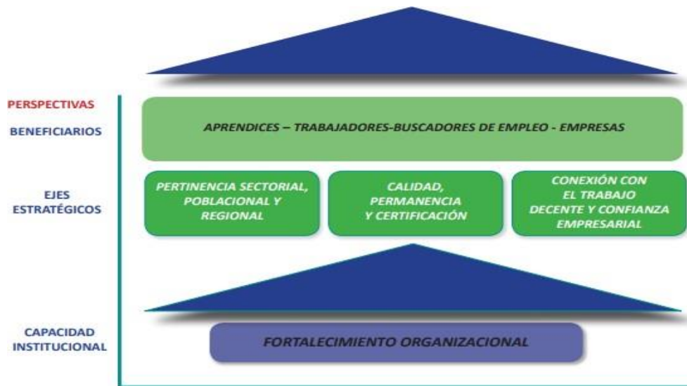
Ilustración 6. Modelo Estratégico

En el Modelo Estratégico definido en el Plan Estratégico del SENA 2015 -2018, que se desarrolla en siete objetivos estratégicos, se establece como mecanismo de alineación el objetivo No. 7. “Consolidar y fortalecer el sistema de gestión que garantice la excelencia en el cumplimiento de la misión y los servicios de alta calidad de la Entidad”, mediante el cual se establecen las directrices tendientes a articular la Gestión del Talento Humano con los objetivos y propósito fundamental de la Entidad.