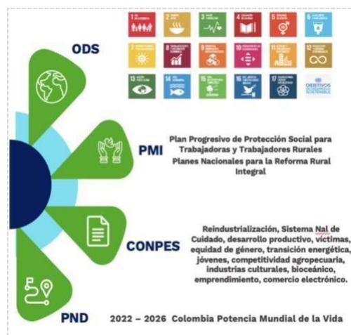
Ilustración 3 Alineación estratégica institucional

Adicionalmente, el modelo de articulación de la planeación estratégica y operativa de la entidad contempla en su alineación estratégica las agendas internacionales que impactan el quehacer institucional, principalmente los objetivos de desarrollo sostenible, los principios del trabajo decente de la OIT, los compromisos institucionales en los planes que conforman el Plan Marco de Implementación, específicamente los relacionados a la reforma rural integral, los cuales aportan al logro de la paz total y la justicia social.