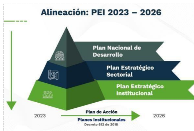
Ilustración 2 Alineación normativa PEI 2023 – 2026

El Plan estratégico institucional atiende el marco regulatorio de la planeación en el país, que señala como todas las entidades deben formular su plan estratégico de acuerdo con el plan nacional de desarrollo. La Ley 152 de 1994 señala como cada uno de los organismos públicos, con base en los lineamientos del Plan Nacional de Desarrollo y de las funciones que le señale la ley, deberá elaborar un plan indicativo cuatrienal (plan estratégico) con planes de acción anuales que se constituirá en la base para la posterior evaluación de resultados. Así mismo, el Decreto 612 de 2018 señala las directrices para la integración de los planes institucionales y estratégicos al Plan de Acción por parte de las entidades del Estado.