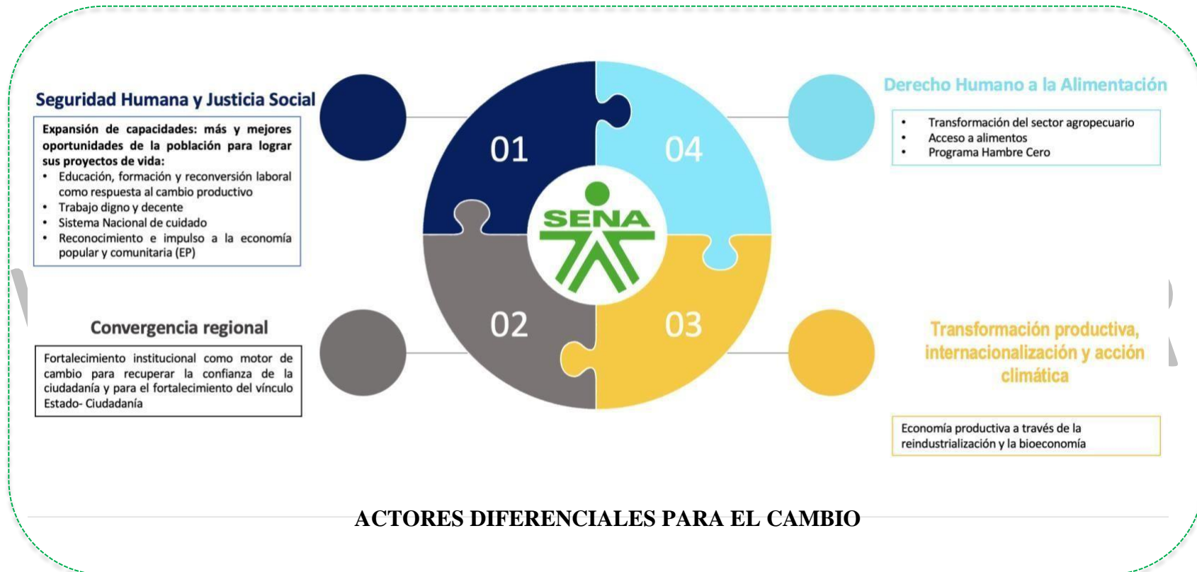
Ilustración 4 Alineación con Plan Nacional de Desarrollo 2022 – 2026