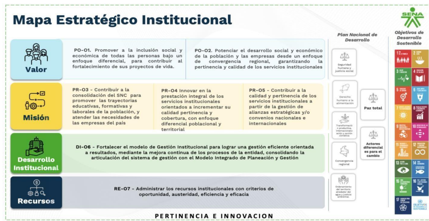
Ilustración 5 Mapa estratégico institucional

El mapa estratégico institucional se elabora con base de la metodología de balance scorecard, el cual busca articular las 4 perspectivas institucionales con el fin de lograr la creación de valor público, por medio de los habilitadores de pertinencia e innovación: