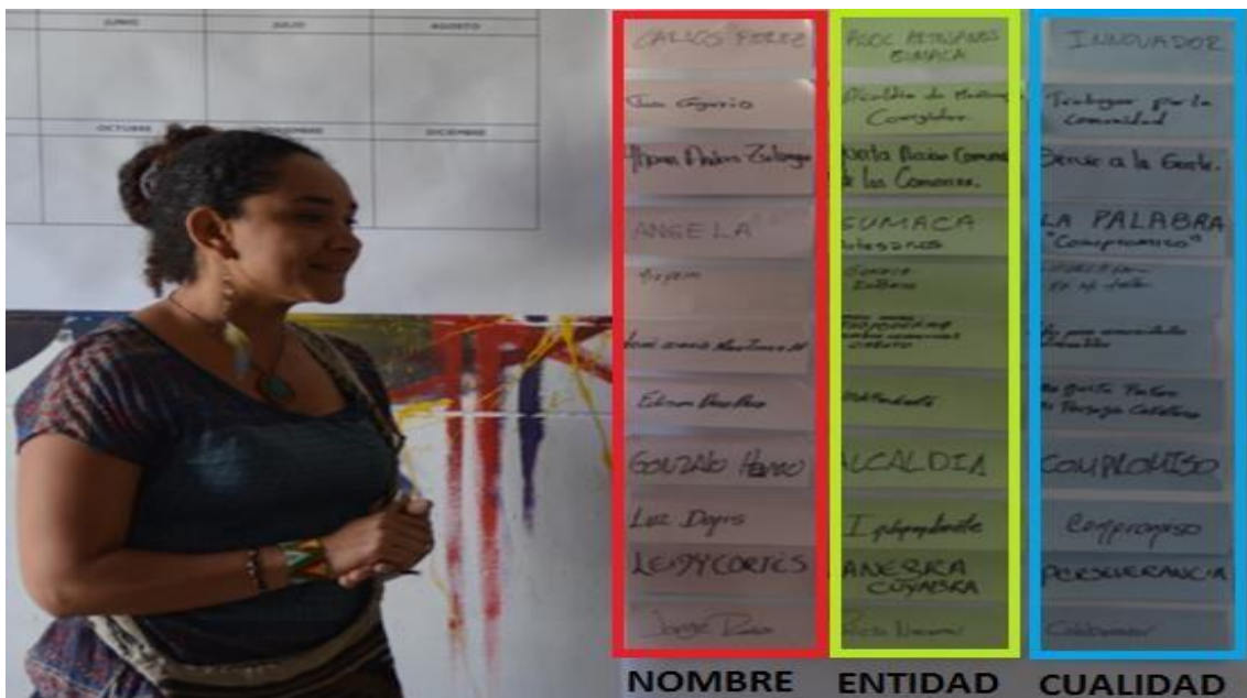
Imagen 1 – Presentación de los participantes