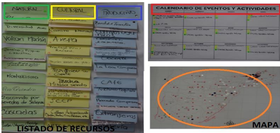
Imagen 2 – Identificación y ubicación de tesoros