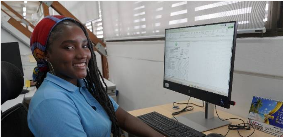
Beneficiaria del Contrato Laboral de Aprendizaje realizando su etapa productiva en el SENA Chocó.

La dinámica del mercado laboral continúa abriendo espacios para los aprendices del Servicio Nacional de Aprendizaje (SENA), gracias al fortalecimiento del Contrato de Aprendizaje.