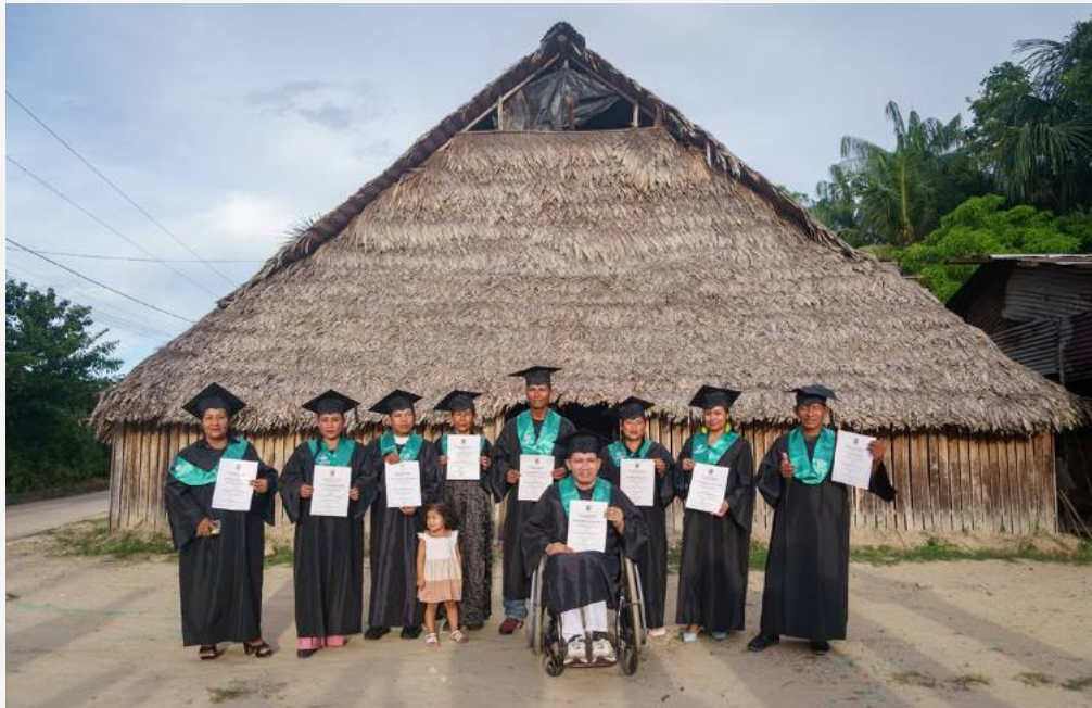
Aprendices del Cabildo TIWA, exhiben con orgullo su certificación frente a la maloca de su comunidad.

Diez aprendices del Cabildo indígena TIWA, se certificaron como Técnicos en Conservación de Recursos Naturales en su comunidad. Este logro fortalece el cuidado del territorio y abre nuevas oportunidades para el desarrollo sostenible en el Amazonas.