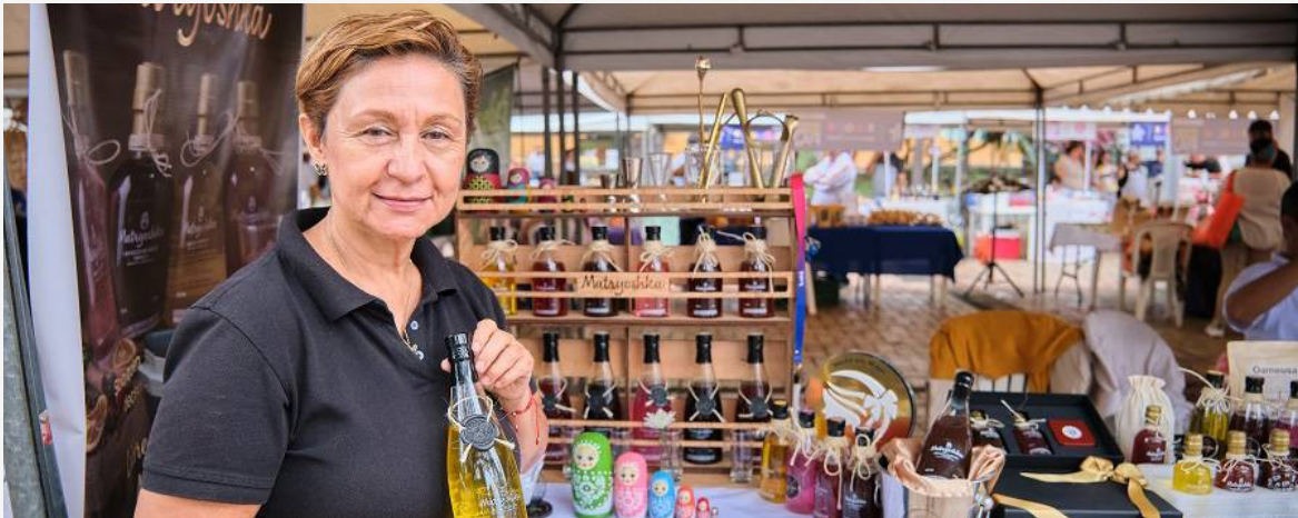
Emprendedora participante de la feria de servicios organizada por la regional Meta en la Plaza Los Libertadores de Villavicencio.

SENA Regional Meta impulsa oportunidades para víctimas del conflicto armado mediante empleo y emprendimiento Más de 92 ofertas laborales y ventas superiores a los 11 millones de pesos evidencian el impacto que genera en la población afectada por la violencia el SENA regional Meta, gracias a la feria “Sembradores de Paz”, donde emprendedores de la región presentaron sus productos.