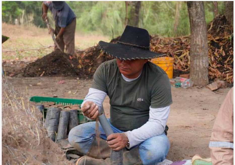
Aprendiz realizando labores de vivero la Granja Municipal del municipio de La Primavera (Vichada).

En La Primavera, el municipio del Vichada, el técnico de Mayordomía en Empresas Ganaderas es la apuesta del Servicio Nacional de Aprendizaje (SENA), para formar e incentivar a los jóvenes de la región, que en su mayoría se a la ganadería y la agricultura, como eje de su actividad económica.