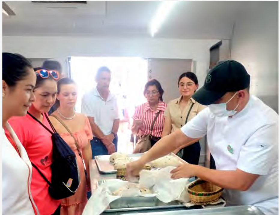
Participantes elaboran pan con masa madre durante jornada de formación del SENA en San Gil.

Más de 50 personas participaron en jornadas de formación en panificación con masa madre lideradas por el SENA Santander en los municipios de San Gil y Villanueva, en el marco del Panfest 2026. La actividad buscó promover alternativas de alimentación más saludables en la región.