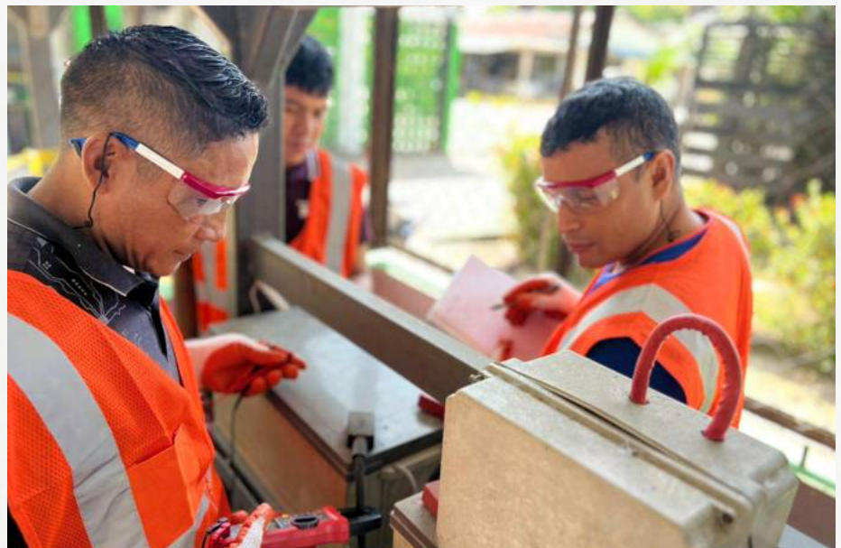
Aprendices del programa de Instalaciones Eléctricas del SENA Regional Guainía, reciben elementos de protección personal y fortalecen sus habilidades mediante prácticas seguras en campo.

En Inírida, el SENA Regional Guainía realizó la entrega de elementos de protección personal a los aprendices del programa Operario en Instalaciones Eléctricas para Vivienda, con el propósito de garantizar prácticas seguras y fortalecer sus competencias técnicas, mediante el aprendizaje en escenarios reales.