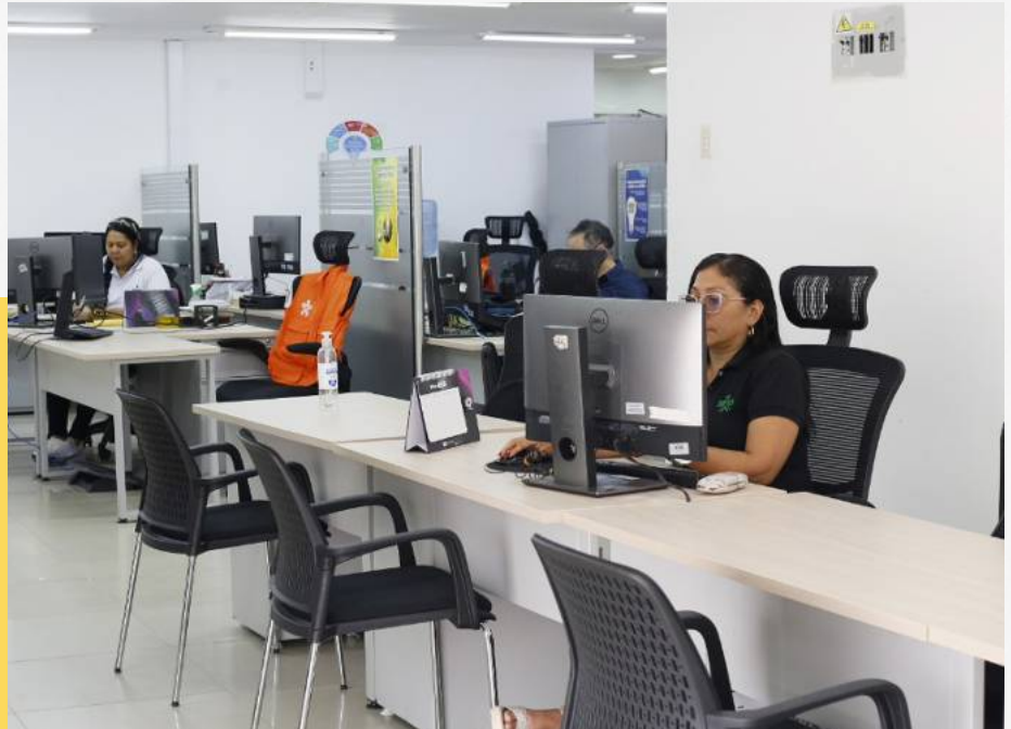
Las áreas intervenidas cuenta con mejor distribución y más privacidad para brindar una óptima atención.

Se modernizaron oficinas administrativas y ambientes formativos, los cuales fueron dotados con nuevo mobiliario y espacios cómodos que apuntan al bienestar general.