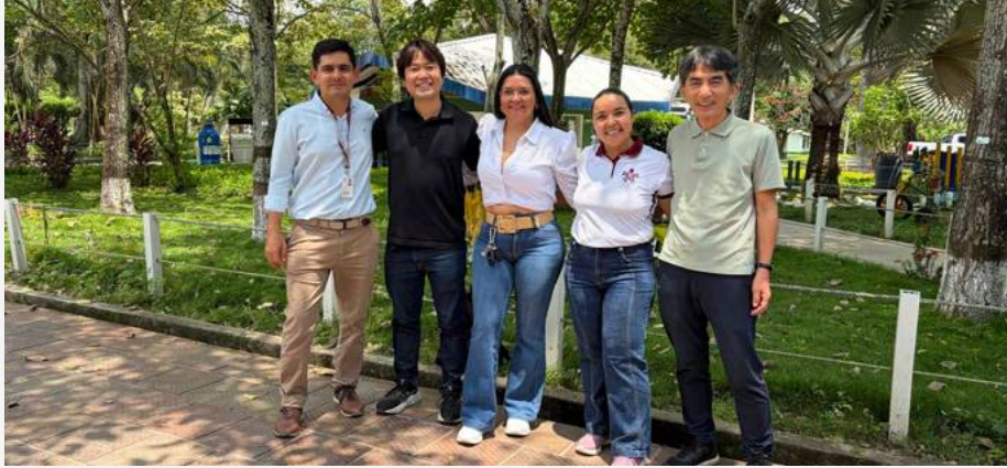
SENA Tolima realiza una alianza con la Agencia de Cooperación Internacional del Japón (JICA), para transformar procesos productivos.

El Centro Agropecuario La Granja (CALG), del SENA Tolima, continúa consolidándose como un referente de innovación en el departamento. Tras una reciente visita oficial de la Agencia de Cooperación Internacional del Japón (JICA), se ha confirmado una alianza estratégica que promete transformar los procesos productivos de la región mediante el intercambio de conocimientos con el país asiático.