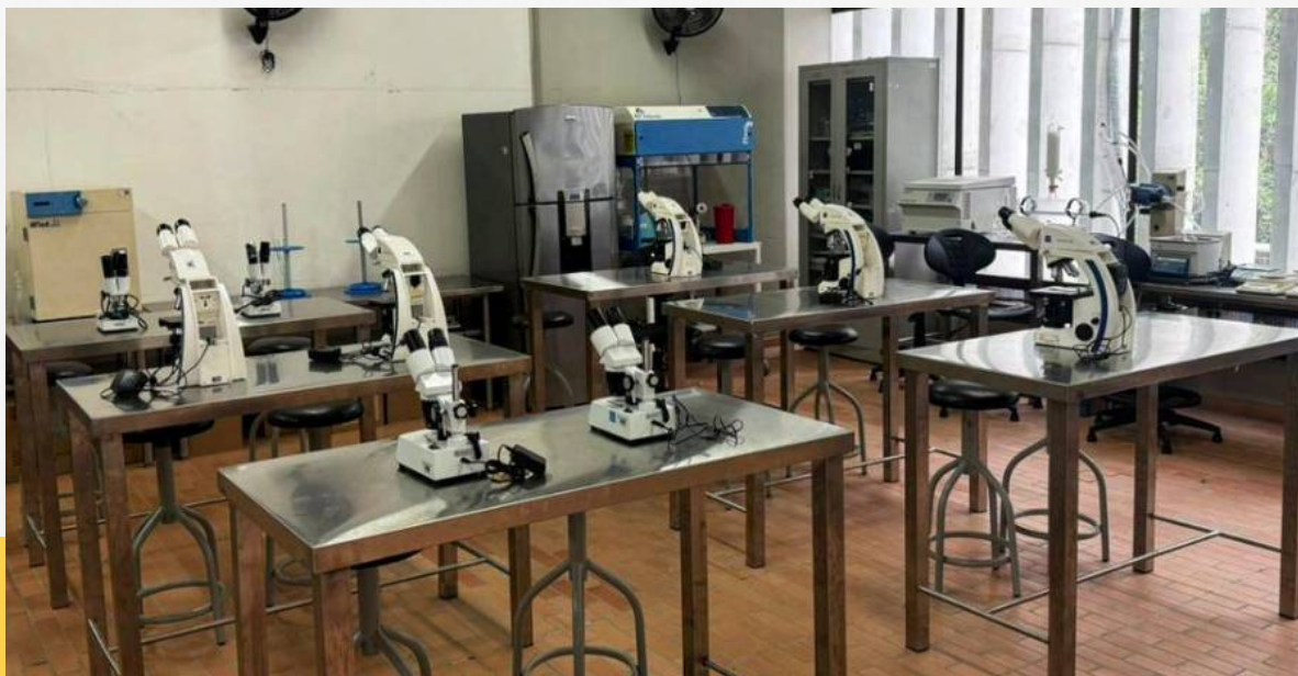
Nueva sede de la Tecnoacademia del SENA en Floridablanca, equipada para la formación en ciencia y tecnología.

El SENA Santander inauguró una nueva sede de la Tecnoacademia en el colegio Vicente Azuero, en Floridablanca, con el objetivo de ampliar la cobertura y fortalecer la formación en ciencia y tecnología para jóvenes del área metropolitana.