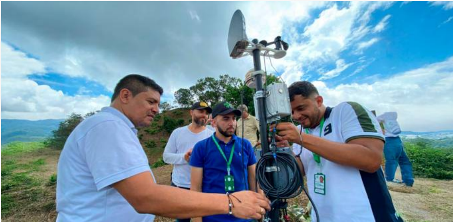
Directivos de Caldas y otras regionales estuvieron en la entrega de los recursos tecnológicos.

El SENA inició la entrega de estaciones agrometeorológicas del proyecto Red Nacional de Cacao con la instalación de dos equipos en Norcasia (Caldas).