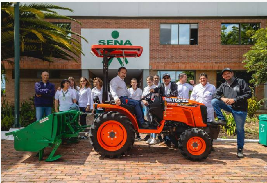
El SENA fortalece la formación rural con la entrega de motocicletas, tractores, implementos agrícolas y buses en todo el país.