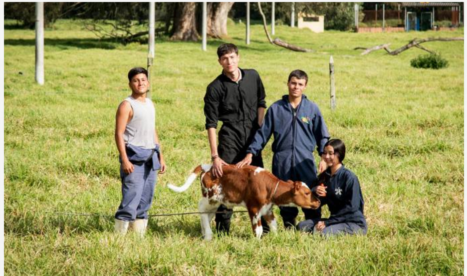
Más de la mitad de los egresados víctimas logra insertarse en el empleo formal en menos de seis meses.

De acuerdo con el más reciente boletín del Observatorio Laboral y Ocupacional, más del 50% de los egresados víctimas del conflicto armado logra vincularse a un empleo formal en los seis meses posteriores a su formación, con variaciones entre regiones y programas.