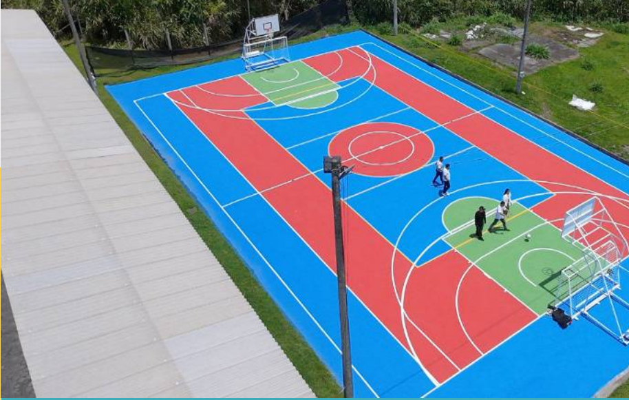
Vista aérea de la cancha multifuncional intervenida por el SENA Caldas, que cuenta con sistema Sport Line 100% acrílico.

El SENA Regional Caldas fortalece sus espacios deportivos para promover el bienestar de aprendices y funcionarios en el departamento.