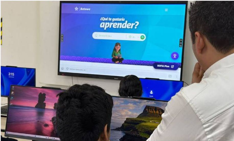
La nueva sala de bilingüismo del SENA en Saravena, equipada con tecnología de punta, fortalece la formación en lengua extranjera y mejora las condiciones de aprendizaje para los aprendices.

Con tecnología de última generación, el SENA Regional Arauca impulsa la formación en idiomas y mejora las condiciones de aprendizaje en la sede Saravena.