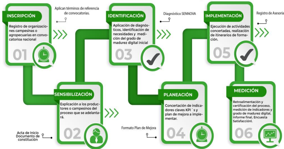
Figura 1. Ruta del proceso para Organización campesina o agropecuaria