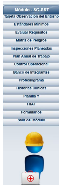
Fig. 3 Se muestran funcionalidades del módulo SST.